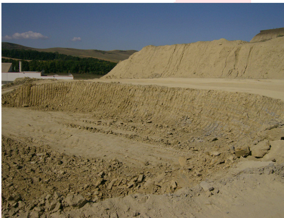
Fig. 1 Cariera de argila / halda de argila

Materia prima principala este reprezentata de argila, provenita din cariera proprie. Argila destinata procesului tehnologic este haldata spre macerare (proces de „imbatranire” al argile), in zona de depozitare a materiilor prime. Intr-o prezentare foarte simpla procesul tehnologic este definit astfel: